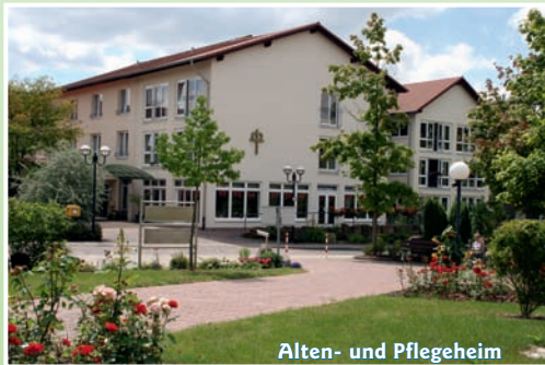
Alten- und Pflegeheim